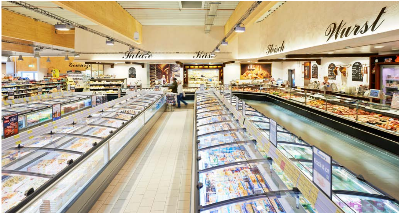
Verbraucher kaufen immer bewusster ein. Sich konstant ändernden Trends zu stellen, bleibt daher ein wesentlicher Erfolgsfaktor für die Zukunft.